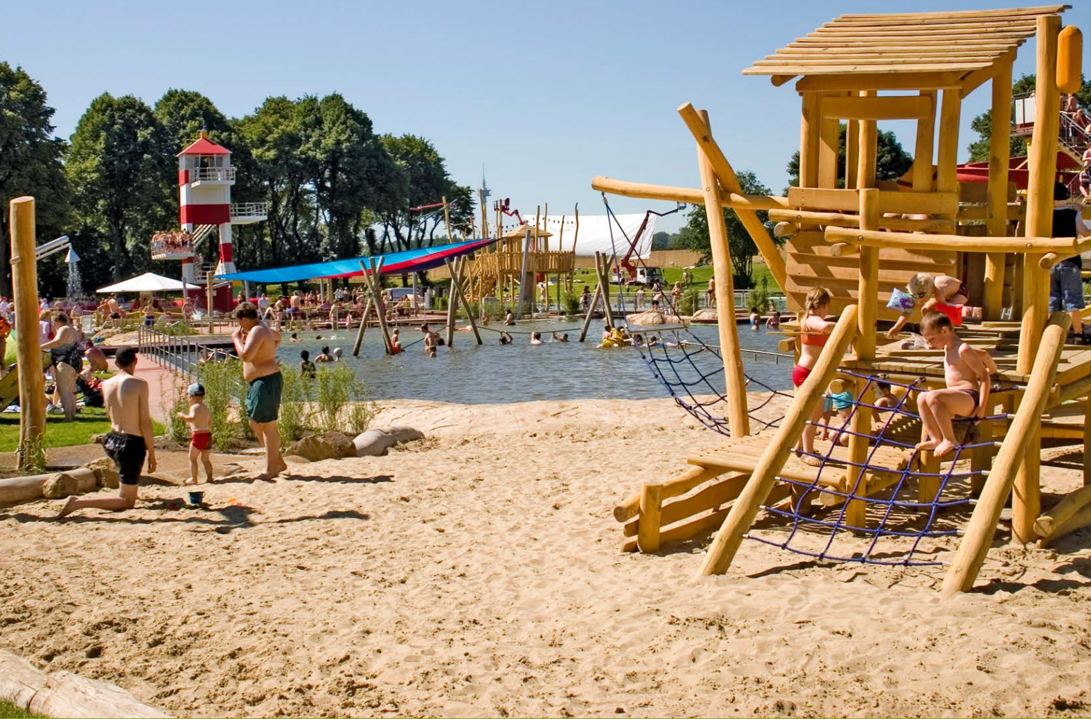
Naturbad Mülheim an der Ruhr

Unsere Schwimmbadtechnik ist grün wie Schilf und schlau wie selbstregulierende Biosysteme.