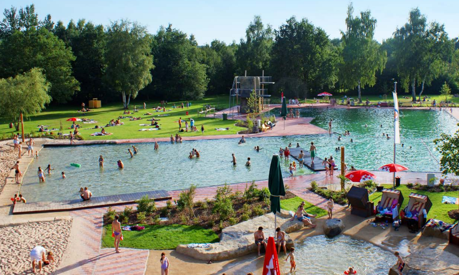
Naturerlebnisbad im Kemnather Land

Diese Zahlen sprechen für sich Entwicklung Badegastzahlen im Naturbad Brackwede